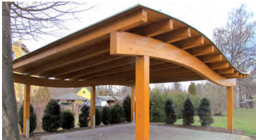
Brettschicht-Holz ist frei formbar für architektonische High-lights.