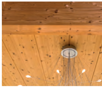
BS-Holz unterstützt ein gesundes, warmes Wohnklima.