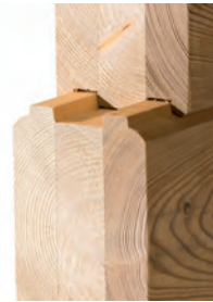
BS-Holz leitet kaum Wärme und verfügt über einen exzellenten Brandschutz (von F30B bis F90B)